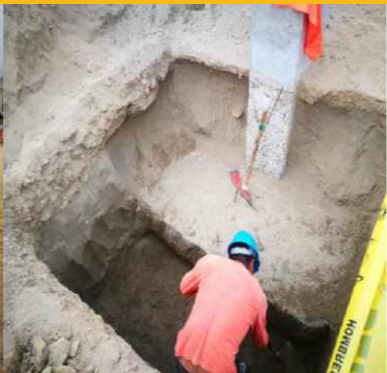
CONSTRUCCIÓN DE CIMENTACION TORRE GRUA PERU PIPING SPOOL SAC. LURIN